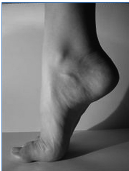
Abb. 1: Der Fuß, das statische Fundament unseres Körpers

Der Fersensporen wird in der Literatur immer als knöcherner Auswuchs (Exostose) am Calcaneus beschrieben und ist im Röntgenbild auch als solcher sichtbar. Es sieht so aus, als ob dieser gefährlich aussehende Dorn die Wurzel allen Übels ist. Fakt ist aber auch, dass viele diagnostizierte Fersensporne gar keine Beschwerden auslösen (über die Hälfte) und dass solche Exostosen bei ca. 10 % der Bevölkerung zu finden sind. Der Sporn bleibt sogar nach erfolgreicher Therapie röntgenologisch weiterhin sichtbar. Die Ursache der Schmerzen ist sicherlich eine Überreizung und daraus resultierende Entzündung des Ansatzes der Plantaraponeurose am Calcaneus. Der Körper lagert nun als frustrierte Reparaturmaßnahme Kalzium in den verletzten Sehnenansatz ein, was zur Verknöcherung führt. Wir bilden ja leider im Laufe der Jahre viele solche Einlagerungen (Arthrose, Arteriosklerose etc.).