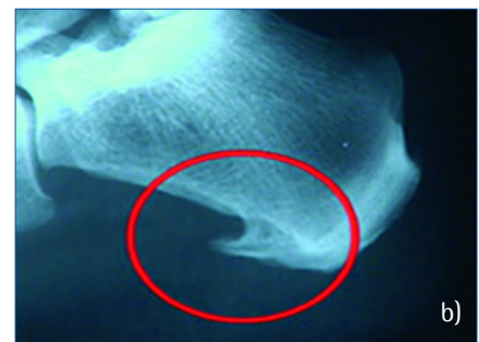
Abb. 2a-b: Der Fersensporen im Röntgenbild

bei jeder Belastung des Fußes angespannt wird.